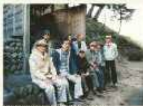
左馬武神社にて/平成3年11月