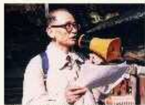
県文化財団創立10周年記念/平成7年

また、古城研究にも情熱を注がれ、昭和47年に静岡古城研究会を創立、初代会長として30年余り会の発展に寄与した。御前崎市内の古城発見・研究とその保存に尽くした。